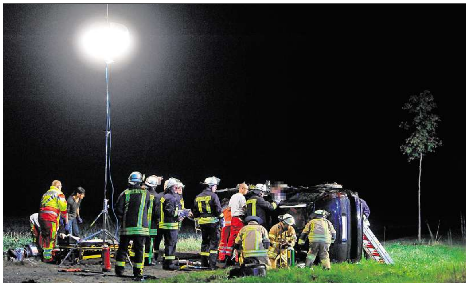
Rettungskräfte rangen am Sonntagabend an der B89 um das Leben einer jungen Frau – vergebens. Es sollte innerhalb weniger Stunden nicht der einzige Unfall mit tödlichem Ausgang bleiben.

Lokalredaktion Sonneberg: Andreas Beer (Ltg.), Martina Hunka (stv.), Uly Günther, Cathrin Nicolai, Raimund Sander, Bismarckstraße 6, 96515 Sonneberg Tel. (0 36 75) 89 38 80, Fax (0 36 75) 70 66 26 E-Mail: lokal.sonneberg@freies-wort.de Lokalsport Sonneberg/Neuhaus: Lars Fritzl, Tel. (0 36 81) 85 11 36, Fax (0 36 81) 85 12 11. E-Mail: lokalsport.sonneberg@freies-wort.de Leserservice (Abo, Zustellung): Tel. (0 36 81) 8 87 99 96 E-Mail: aboservice@freies-wort.de Anzeigenservice für Privatkunden: Tel. (0 36 81) 8 87 99 97 Service-Fax: (0 36 81) 8 87 99 98 Anzeigenservice für Geschäftskunden: Sonneberg: Tel. (0 36 75) 75 41 -66, -67, -68, Fax (0 36 75) 75 41 33, Neuhaus: Tel. (0 36 79) 72 79 45, Fax (0 36 79) 72 79 46 Service-Point: Köppelsdorfer Straße 18, 96515 Sonneberg, Tel. (0 36 75) 82 69 70 Leserreisen: Tel. (0 36 81) 79 24 12 Ticket-Hotline: Tel. (0 36 81) 79 24 13