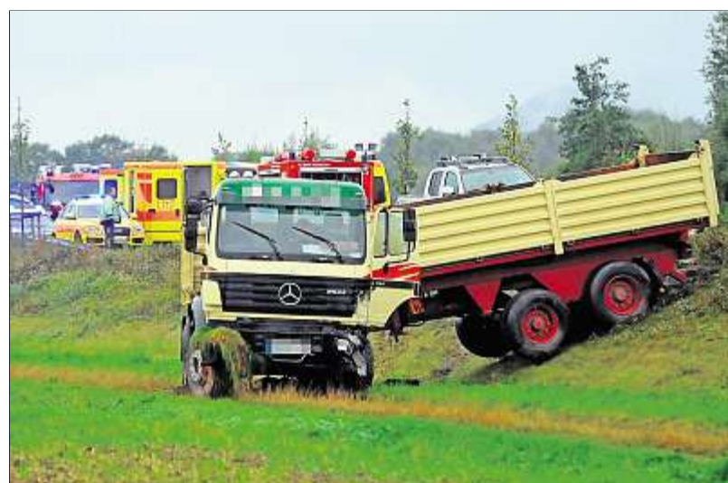
Der Laster blieb erst in der Wiese stehen.

Inwiefern Veränderungen in der Verkehrsregelung nötig sind, möchte man im Straßenbauamt Südwestthüringen, das für die Bundesstraße zuständig ist, offen lassen. Benjamin Schluse räumt ein, dass die Verkehrsregelung in der Vergangenheit mehrfach zu Streitfragen innerhalb des Amtes geführt hätte. „Möglicherweise müssen wir aber auch manche Regelung doch noch einmal überdenken“, sagt Schluse. ts