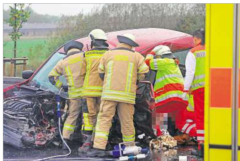
Der Kangoo stieß frontal mit einem Lkw zusammen.