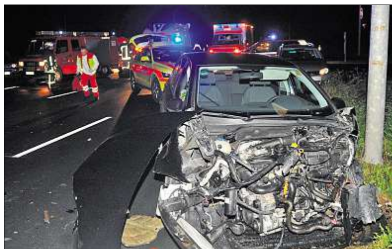
Das Fahrzeug des mutmaßlichen Unfallverursachers am Sonntagabend an der Kreuzung auf der B89.

Nach den Angaben der Polizei wollte am Sonntagabend gegen 20.20 Uhr ein 27-jähriger Golfspieler mit Coburger Landkreis-Kennzeichen aus Richtung Rottmar kommend die Ortsumfahrung Sonneberg in Richtung Oberlind queren. Dabei habe er die Vorfahrt eines Ford, der aus Unterlind kommend auf der B89 in Richtung Förritz fuhr, missachtet. Im Kreuzungsbereich kam es zur Kol-